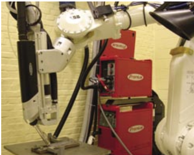
Hybride laskop: de combinatie van een Nd:YAG laser en een halfautomatisch lasproces, gemonteerd op een robot.

Het hybride laserlassen werd al in de jaren zeventig ontwikkeld. Nu komt het opnieuw in de aandacht door de stijgende populariteit van industriële laserlasprocessen, die echter ook hun nadelen hebben. Bovendien bieden lastechnieken met hogere vermogens, hogere rendementen en een betere kwaliteit de industrie alleen maar voordelen.