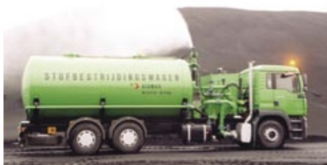
Arcelor Gent pakt diffuse fijnstofemissies onder meer aan door wegen en grondstoffenstapels te besproeien bij droog weer.

VITO paste de 'hotspots'-methodiek toe, een innovatief rekenmodel om pollutanten in de lucht te meten en te modelleren. De VITO-onderzoekers maten de emissie van fijn stof op aan de productie-installaties en op kritische locaties op de fabrieksterreinen, zoals opslagplaatsen van erts en kolen. Ook buiten het bedrijfsterrein werd het fijn stof gemeten. Deze meetgegevens vulde VITO aan met de totaalstofmetingen die Arcelor Gent zelf uitvoert aan zijn fabrieksgrenzen. Al deze resultaten werden gebruikt als input voor een computermodel dat VITO op maat van de Arcelor Gent-terreinen aanpaste. Het model berekent de emissies van fijn stof en op basis daarvan worden concentraties op grotere afstanden van de fabriek bepaald.