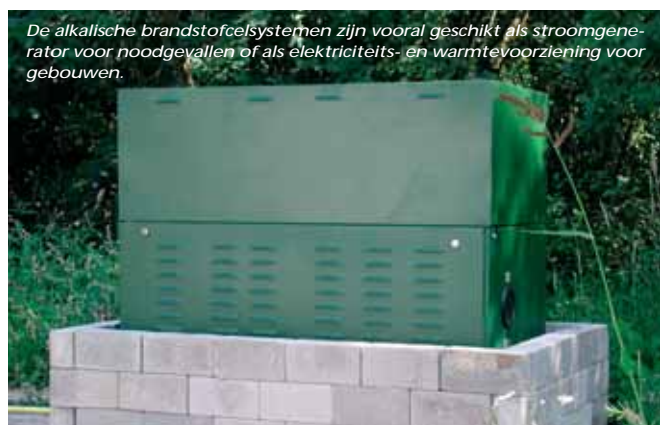
De alkalische brandstofcelssystemen zijn vooral geschikt als stroomgenerator voor noodgevallen of als elektriciteits- en warmtevoorziening voor gebouwen.

Door haar aanwezigheid in internationale netwerken, helpt VITO bij de internationale commercialisering van Vlaamse technologieën. En dat is mooi meegenomen voor de uitstraling van Vlaanderen als hoogtechnologische regio.