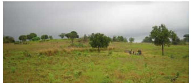
Uitgebreide veldcampagnes leveren traditioneel de basisgegevens op voor voorspellingen van de landbouwproductie in Afrikaanse landen. Aan het begin van het groeiseizoen brengen duizenden medewerkers ieder jaar in kaart waar wat geteeld wordt. Aardobservatie maakt dit tijdrovende, arbeidsintensieve karwei efficiënter en nauwkeuriger.

Het uiteindelijke doel van de areaalinschattingen is het voorspellen van gewasopbrengsten op nationaal niveau. De overheid van Malawi beschikt hiervoor over een gewasgroeimodel, ontwikkeld door de FAO (Food and Agriculture Organization of the United Nations) en algemeen toegepast door de Afrikaanse landen. Satellietbeelden laten toe vegetatieveranderingen te monitoren en kunnen helpen om dit model efficiënter en beter te maken. Hierbij wordt gebruikgemaakt van NDVI-beelden (Normalised Difference Vegetation Index), die door VITO worden aangeleverd. De NDVI is een vegetatie-index die wordt berekend uitgaande van de reflectantiewaarden in het zichtbaarrood- en in het infraroodgebied. De resulterende waarde is een indicatie voor de aanwezigheid van vegetatie op het landoppervlak. Toegevoegd aan het bestaande model, laat deze informatie over de gewasgroei toe betere en vroegere voorspellingen te maken.