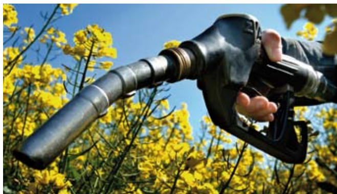
Premia leert dat biobrandstoffen het meest gebaat zijn bij een mix van maatregelen: technische voorwaarden in combinatie met financiële prikkels in een gunstig investeringsklimaat.

De Europese Commissie stelt dat tegen 2020 maar liefst 20 % van de transportbrandstoffen moet vervangen worden door alternatieve brandstoffen. Er zijn nog heel wat hindernissen te nemen vooraleer deze brandstoffen - het is te zeggen biobrandstoffen, waterstof en aardgas - op grote schaal worden toegepast. Toch is er tegelijk een hele reeks maatregelen beschikbaar om dit proces te versnellen. Het Premia-project, een Specific Support Action binnen het Zesde Kaderprogramma, nam deze maatregelen onder de loep en legde de marktsituatie in verschillende Europese lidstaten bloot. De focus lag daarbij op biobrandstoffen. Het leeuwendeel van de biobrandstofproductie in Europa - ethanol en biodiesel - is voor rekening van vijf landen: Duitsland, Frankrijk, Italië, Spanje en Zweden. Tussen 2003 en 2006 is de totale consumptie van biobrandstoffen in Europa ongeveer verdrievoudigd. Anno 2005 nam ze iets meer dan 1 % in van alle transportbrandstoffen in de EU. De productiekost van biobrandstoffen ligt hoger dan die van fossiele brandstoffen, zelfs met de huidige hoge olieprijsen. Biobrandstoffen hebben daarom nood aan steunmaatregelen om door te breken op de markt.