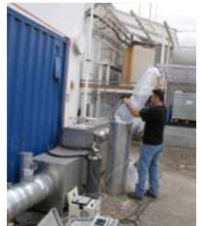
De validatietests voor deze plasmatechnologie voor geurbestrijding voert VITO zelf uit.

PROMOTE focust op een ander compartiment van het leefmilieu: de bodem en het grondwater. In-situtechnieken zoals soil flushing (bodemdoorspoeling) en permanente reactieve wanden hebben de bovenhand in het project, maar ook één ex-situtechniek - additieven om bioremediatie te bevorderen - werd opgenomen. Het project omvat ook een luik rond meettoestellen, maar VITO is enkel betrokken