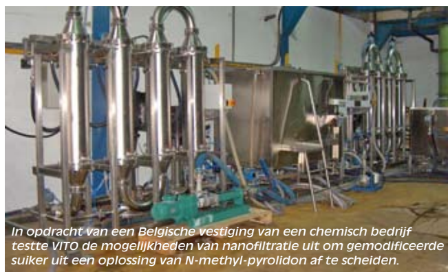
In opdracht van een Belgische vestiging van een chemisch bedrijf testte VITO de mogelijkheden van nanofiltratie uit om gemodificeerde suiker uit een oplossing van N-methyl-pyrolidon af te scheiden.

Pervaporatie wordt op industriële schaal bijvoorbeeld ingezet om alcoholen te ontwateren. Een interessante toepassing is de ontwatering en opzuivering van bio-ethanol, waarbij een verdunde oplossing (5 à 10 %) wordt omgezet in commerciële bio-ethanol. Momenteel maken producenten gebruik van een hybride opstelling: een distillatiekolom voor de ontwatering met een nageschakelde pervaporatie voor het opzuiveren. Onderzoek loopt om dit procedé integraal om te turnen tot een pervaporatieproces. Ook de combinatie van pervaporatie met een chemische reactie is veelbelovend. Eén van de reactieproducten wordt weggetrokken via pervaporatie. Dit zorgt voor een verschuiving van het evenwicht, waardoor de reactie vollediger en sneller opgaat. Een voorbeeld is de combinatie met veresteringsreacties, waarbij het onttrekken van water een beter product geeft in een kortere reactietijd.