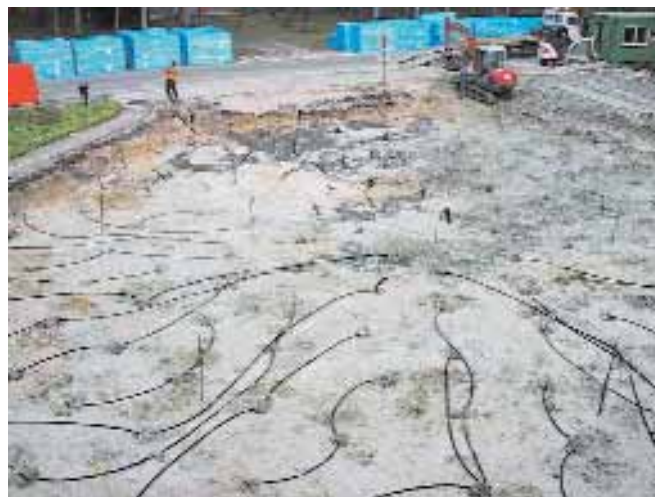
Het netwerk van verticale warmtewisselaars kan in elk bodemtype worden ingebracht. In de buizen stroomt water of een andere milieuvriendelijke vloeistof, zoals propyleenglycol.

Een BEO-systeem verdient zichzelf in tien jaar terug op voorwaarde dat het ontwerp en de dimensionering doorzacht gebeuren. VITO bouwde een voor Vlaanderen unieke expertise uit in dergelijke systemen. Ze voert haalbaarheidsstudies uit in opdracht van bedrijven, ziekenhuizen en overheden. Met een zelf ontwikkelde meetwagen onderzoeken VITO-experts ter plaatse de thermische eigenschappen van de bodem. Ze begeleiden studie bureaus ook bij het hele verdere traject: van ontwerp, over het opstellen van lastenboeken, tot en met de uitvoering van de werken.