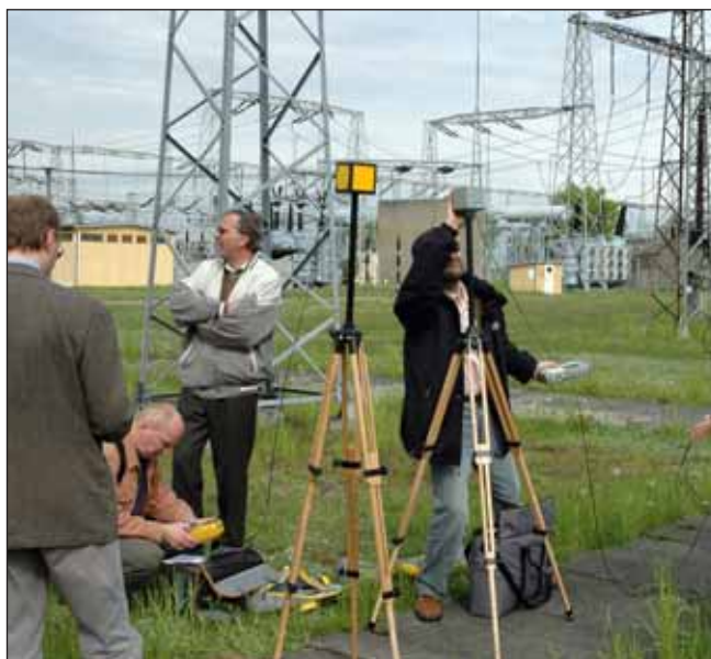
Elektromagnetische velden meten en de risico's ervan evalueren is specialistenwerk. VITO helpt bedrijven de blootstelling te beperken, zowel tijdens het ontwerp van nieuwe plants als voor bestaande installaties.

Om elk risico tot een minimum te herleiden, is een goed actieplan nodig. Ervaring helpt hier bij het selecteren van de