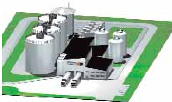
Driehonderd meter ondergrondse leidingen transporteren jaarlijks 120 000 ton aardappelresten naar de vergistingsreactor. Daarnaast wordt nog eens 30 000 ton biomassa uit andere levensmiddelenbedrijven aangevoerd.

Ook in het energieluik adviseerde VITO. Zo bestudeerde ze de samenstelling van het biogas, omdat die bepalend is voor de energieoutput van de gasmotor. Uit die studies bleek ook dat de concentratie waterstofsulfide in het biogas minimaal was en dus geen corrosieproblemen zou veroorzaken. VITO hielp verder bij de juiste dimensionering van de WKK-gasmotor en berekende de te verwachten warmte- en