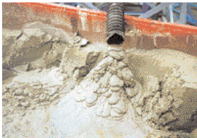
Het bodemwasproces resulteert enerzijds in een stroom zuiver zand (foto onder) en anderzijds in een aantal reststromen, zoals een koolhoudende stroom (foto boven).

ofwel vermengd wordt met nutriënten voor de stimulering van bodemeigen micro-organismen ofwel met chemische oxidantia, geselecteerde bacteriën, schimmels of een combinatie van deze twee. De resultaten van dit procédé stelden enigszins teleur, zowel in de laboratoriumtest als op de demonstratiesite. Er kon niet voldoende biodegradatie van de verontreinigingen worden vastgesteld. Wellicht is dit te wijten aan de slechte beschikbaar-